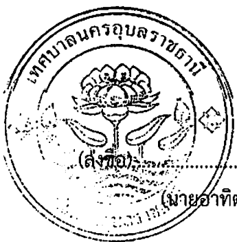
ผู้ว่าจ้าง (นายอาทิตย์ คุณผล)

ใช้สูตร K = 0.35 + 0.20 \text{ Lt/L0} + 0.15 \text{ Ct/Co} + 0.15 \text{ Mt/Mo} + 0.15 \text{ St/So}