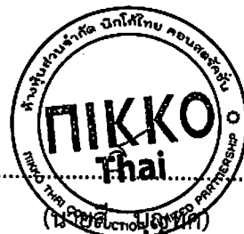
(ลงชื่อ).....ผู้รับจ้าง